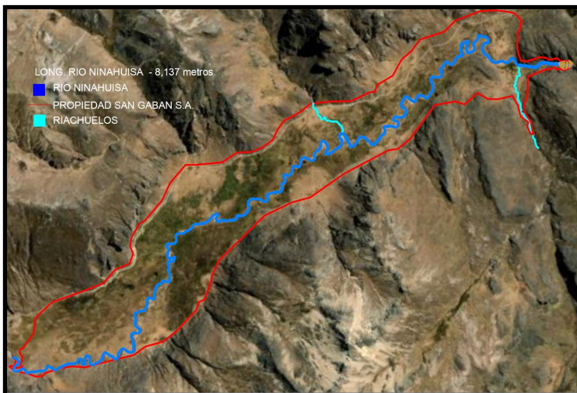
Figura 1 Descripción área de franja marginal

Este estudio deberá realizarse en estricto cumplimiento de la Resolución Jefatural N° 332-2016-ANA, que aprueba el "Reglamento para la delimitación y mantenimiento de fajas marginales", a fin de garantizar que la delimitación se ajuste a las normativas vigentes y que se proteja adecuadamente la zona ribereña conforme a los requisitos técnicos y legales establecidos.